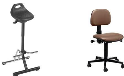
1. ábra: Állótámasz és munkaszék

Arra kell törekedni, hogy minél kevesebb legyen a monoton, állandóan ismétlődő mozdulat a folyamatban, ugyanakkor úgy kell kialakítani a munkahelyet, hogy a munkavállaló szabadon megválaszthassa, hogy meddig végzi ülve vagy állva a munkáját. A harmadik lehetséges variáció az üleptámasz (állótámasz) alkalmazása.