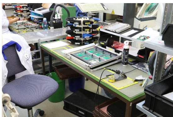
2. ábra: Ülve végzett munka

Az asztal felülete az elvégzendő munkához, az anyagok, a segédanyagok és az eszközök tároláshoz elegendő méretű legyen! Az állítható lábtámasz alkalmazása is célszerű egyéni igények szerint.